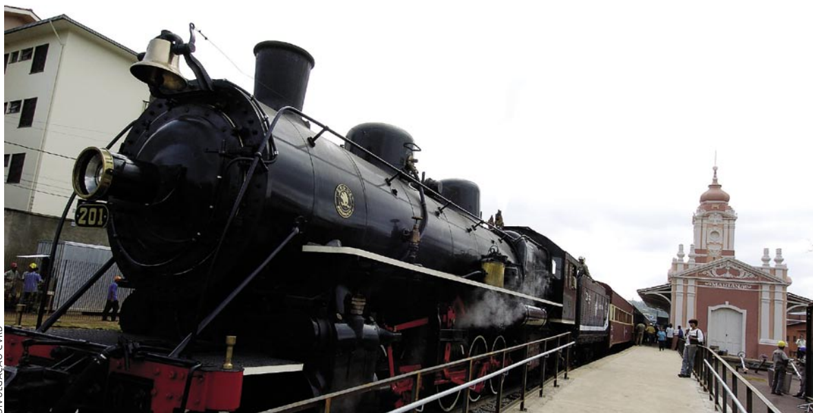
Maria-fumaça de volta às estradas históricas de Minas Gerais, graças a um projeto da Companhia Vale do Rio Doce.

Empresas reconhecem o patrimônio que suas histórias representam para a sociedade brasileira e aderem a uma nova tendência: a responsabilidade histórica.