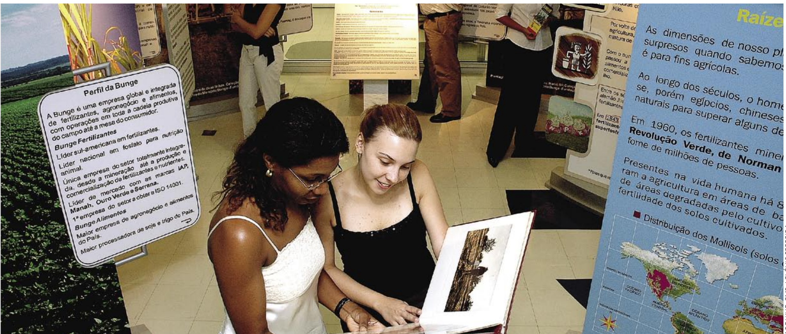
Exposições temáticas realizadas pelo Centro de Memória Bunge já atraíram 150 mil pessoas, em 13 anos.