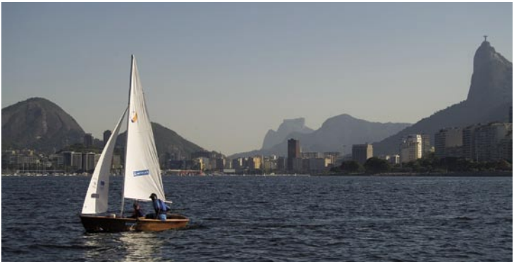
Mutirão de limpeza mobiliza moradores da região. Saracura navega pela Baía de Guanabara, onde se apresentou nos XV Jogos Pan-Americanos.

A vela está abrindo os horizontes dos jovens do bairro paulistano do Jardim das Gaivotas que participam do Saracura, um dos três projetos que compõem o programa de atuação da organização social Vento em Popa.